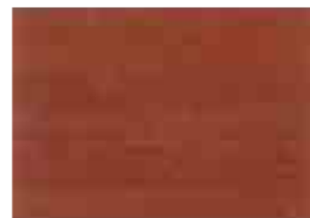
U-418 Burma týk